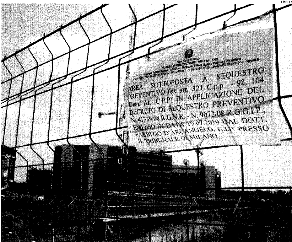
L'area sotto sequestro. Il cantiere di Santa Giulia a Milano

« Ecco il verbale di un incontro tra Comune, Arpa, Asl e proprietà di Santa Giulia, del 15 gennaio 2009 nel quale si analizza l'ultima analisi di rischio effettuata sull'area: « Il Comune alla luce del parere tecnico espresso dagli enti ritiene che siano stati ottemperati gli obblighi convenzionali in merito al raggiungimento di obiettivi di qualità compatibili con la tutela della salute umana e dell'ambiente ».