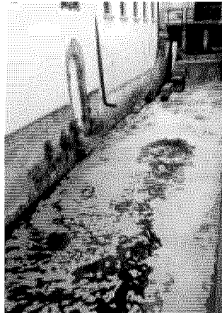
La schiuma bianca presente