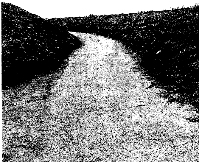
Contrada Marrella a Gioia Tauro. Le acque sotterranee provenienti dall'area delle due discariche sono contaminate dall'arsenico